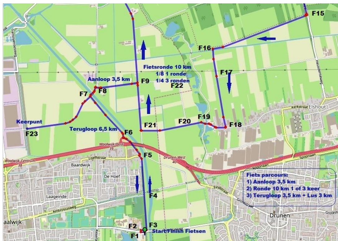
Figuur 5 Tekening fietsparkoers

Het fietsparkoers en één mooie ronde door de polder met een aanloop van 3,5km en een terugloop (met een klein heen en weer stukje erin) van 6,5km. In totaal dus 20km.