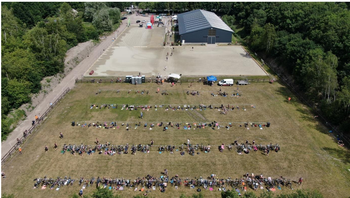
Figuur 2 Overzichtsfoto evenemententerrein Tanis Triathlon de Langstraat

Een gedeelte van het witte zand is bestemd voor de teamtenten, inschrijving is vooraan in de kantine van de rijhal en in de rijhal zelf is plaats om je tas neer te zetten.