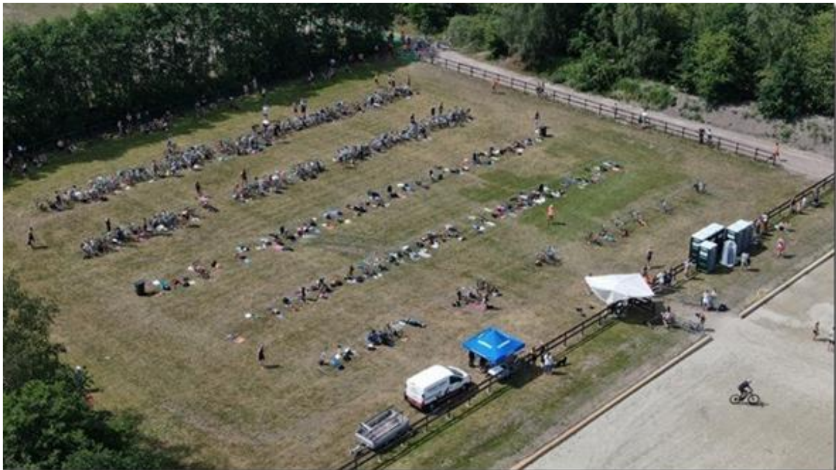
Figuur 3 Overzichtsfoto wisselzone

De penalty box bevindt zich in de wisselzone. Stayeren mag niet, dus niet doen, maar als je onverhoopt een straf krijgt, zit hem uit in de penalty box.