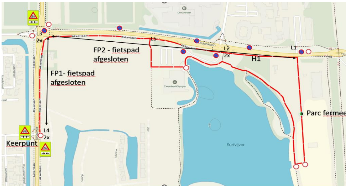
Figuur 6 Tekening loopparkoers

Het loopparkoers en een heen en weer parkoers met een mooie lus, onverhard langs de surfvijver en langs de supporter. Deze route leggen jullie twee keer af, in totaal 5 km.