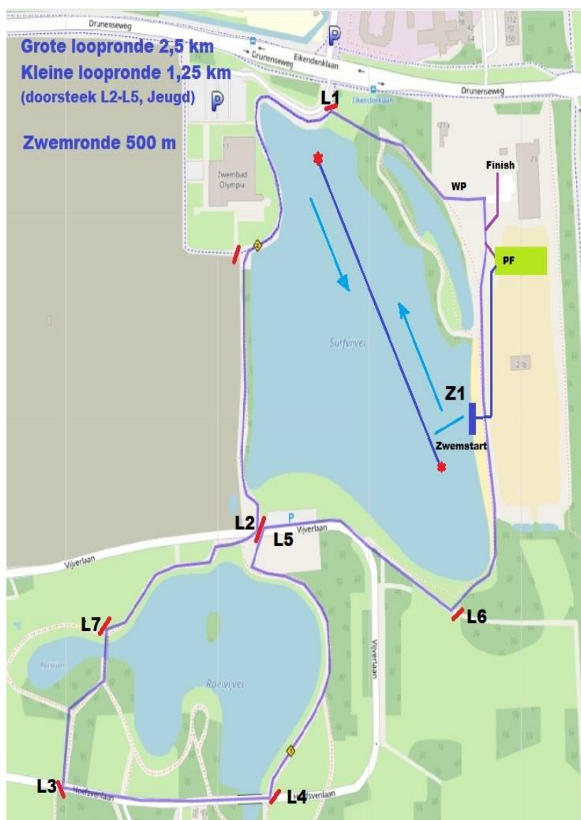
Figuur 1 Loop en zwemparcours