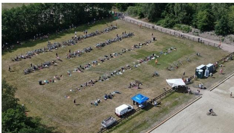
Figuur 1 Parc fermee