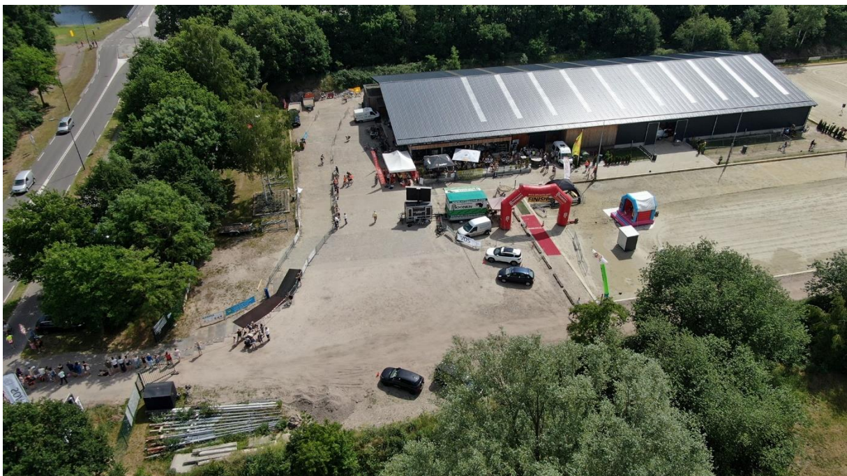
Figuur 2 Het evenemententerrein

Het evenemententerrein is opgebouwd rondom ons clubhuis en de manege van de Paardenvriend (onze buurman). Ten opzichte van de eerste Tanis triathlon de Langstraat hebben we de looplijnen van de atleten en die van de bezoekers uit elkaar gehouden. Zo hebben de atleten alle ruimte en kan het publiek bij alle onderdelen om hun pupillen aan te moedigen.