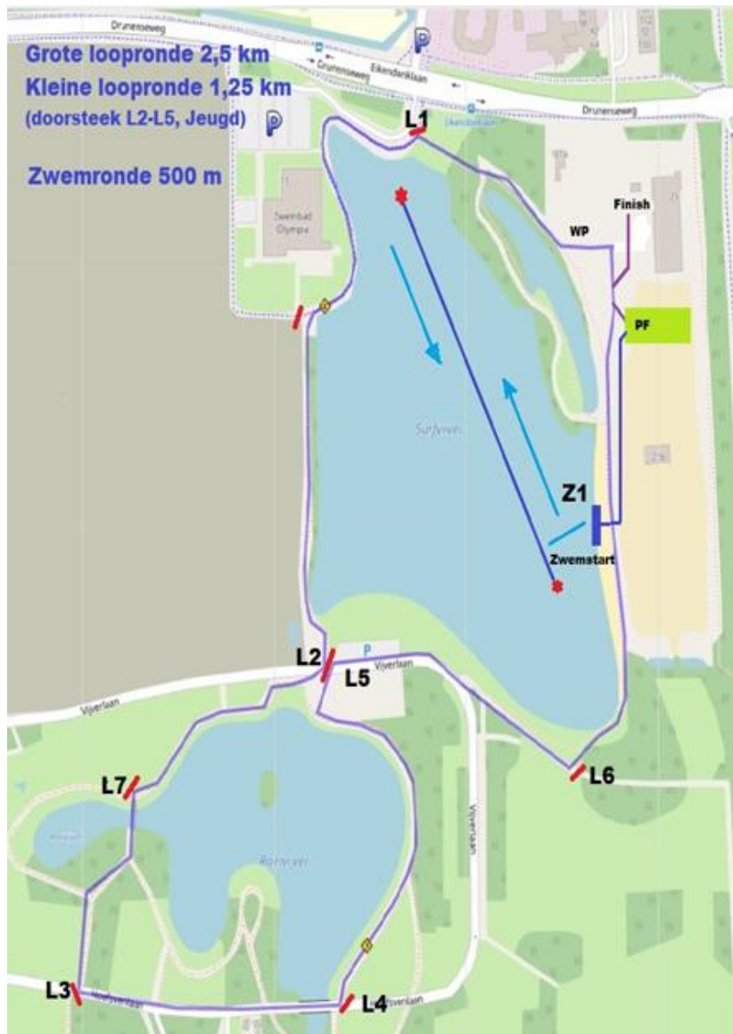
Figuur 1 Loopparcours

Bij het lopen is een waterpost bij de doorkomst vlakbij start/ finish.